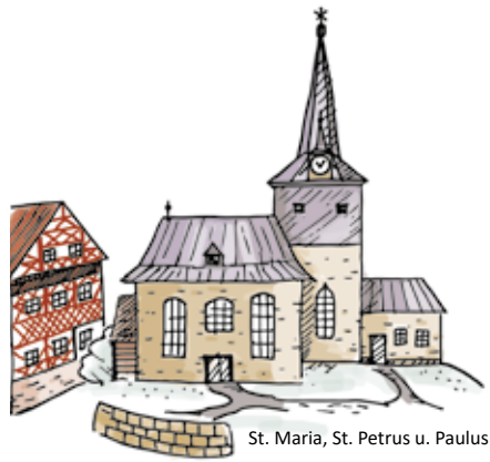
St. Maria, St. Petrus u. Paulus