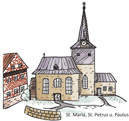
St. Maria, St. Petrus u. Paulus