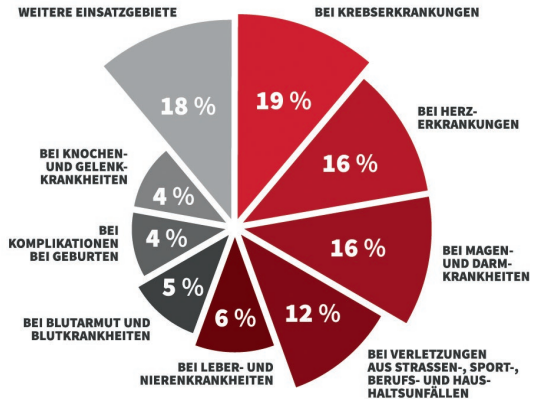
INFOGRAFIK: VERWENDUNG VON BLUTPRÄPARATEN

Täglich werden in Bayern rund 2.000 Blutspenden für die Versorgung von Verletzten und Kranken benötigt. Auch ein perfektes medizinisches Versorgungssystem ist bei schweren Verletzungen und lebensbedrohlichen Krankheiten ohne Blut nicht funktionsfähig. Viele Operationen, Transplantationen und die Behandlung von Krebspatienten sind nur dank moderner Transfusionsmedizin möglich. Statistisch gesehen wird das meiste Blut inzwischen zur Behandlung von Krebspatienten benötigt. Es folgen Erkrankungen des Herzens, Magen- und Darmkrankheiten, Sport- und Verkehrsunfälle.